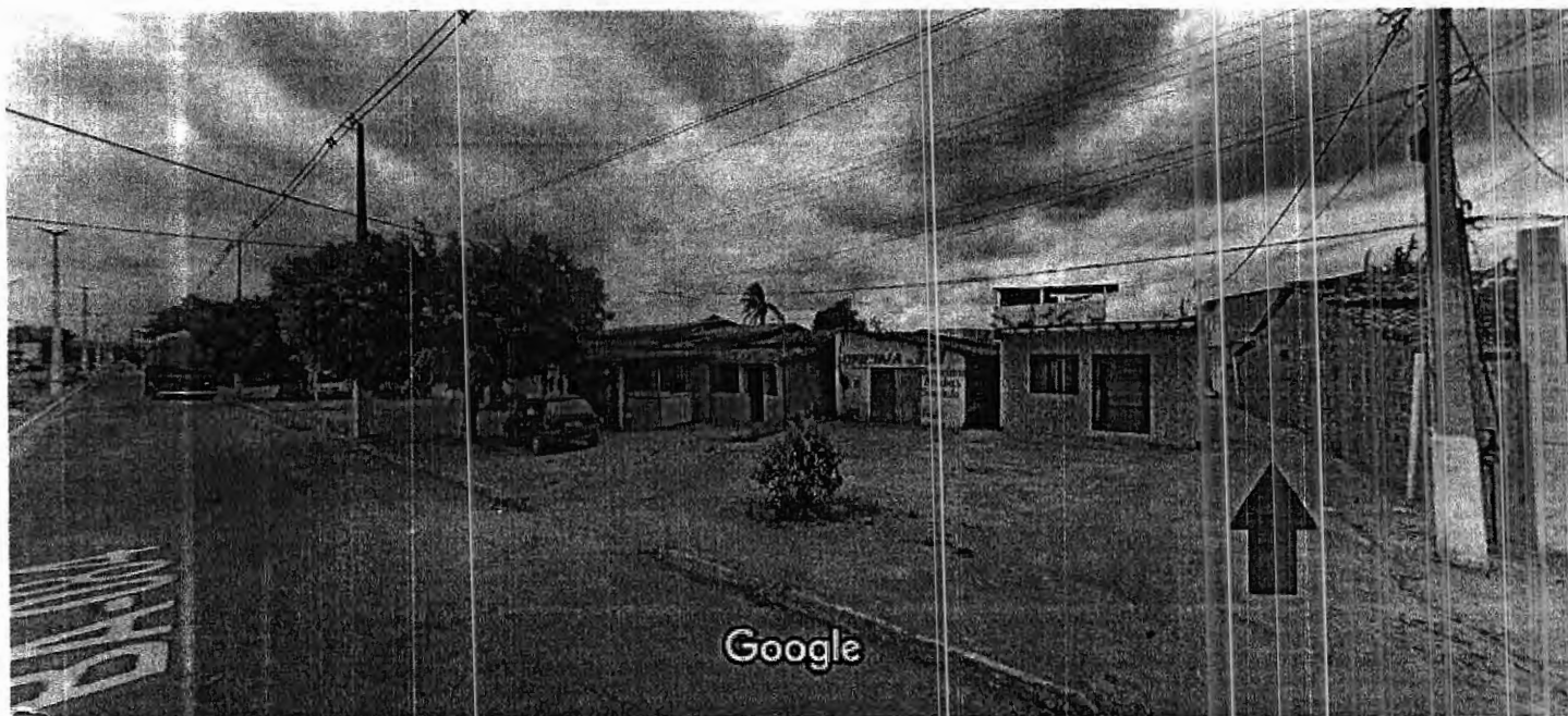
Captura da Imagem: set. 2021